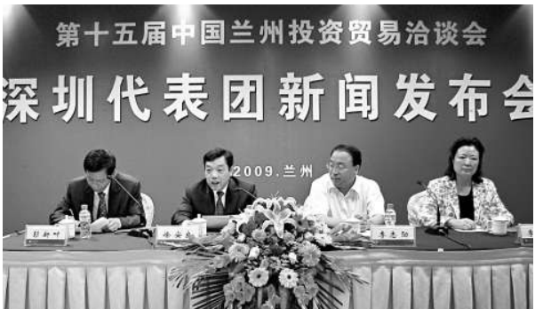
▲深圳市在蘭洽會新聞發布會，有多位官員沒有出席