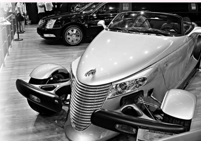
▲一款造型奇特的汽車吸引了觀眾的目光

實際上，深圳缺少汽車工業的歷史正在逐漸改變，隨着比亞迪汽車和哈飛汽車的落戶，國內外各大汽車廠商也加快了在深圳試水新產品的力度，眾多廠家的戰略新車選擇在深圳進行華南首發。本次車展上，東風本田的神秘戰略車型SR-9將以正式公布中文名；日產超級跑車GT-R，起亞新款高檔越野車索蘭托、名爵MG6、安鈴木新奧拓等都將進行華南首發儀式。