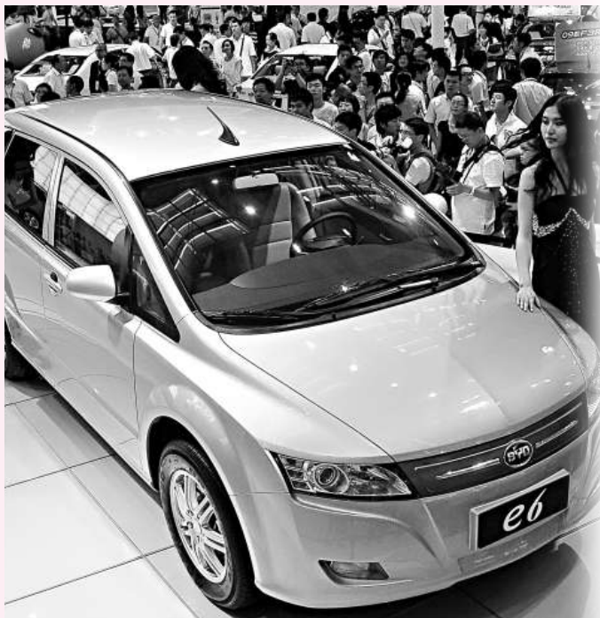
▲眾多觀眾在深圳舉行的深港澳國際汽車博覽會上參觀