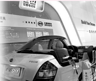
▲去年底實現量產的比亞迪雙模電動汽車亮相