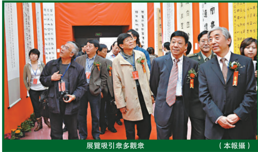
展覽吸引眾多觀眾