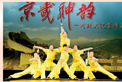
集劍、刀、棍術於一體的《飛簫神韻》，表演者均為全國冠軍、亞洲冠軍或世界冠軍

「都市浪漫」將於本月十二至十三日（星期五及六）晚上八時在葵青劇院演藝廳舉行，門票於各城市電腦售票處發售。