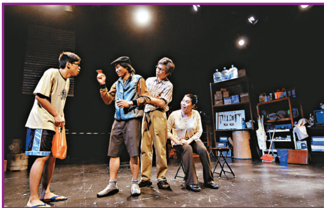
演戲家族演繹《車你好冇》