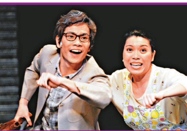
《車你好冇》的角色在逆境中積極解決生活困難