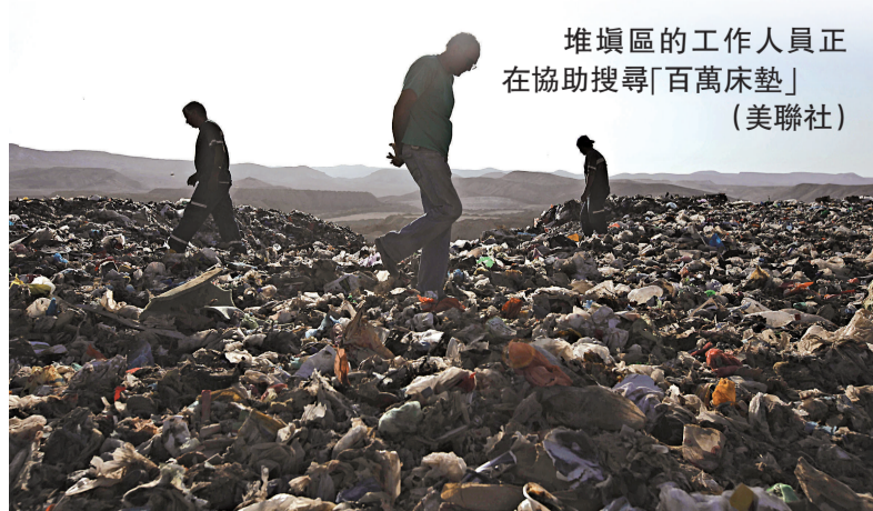
堆填區的工作人員正在協助搜尋「百萬床墊」

這名婦女說，雖然自己對找到床墊仍抱有希望，但擔心現金早已被人拿走。她拒絕公開自己的姓名，部分媒體報道使用化名「阿娜特」。(新華社)