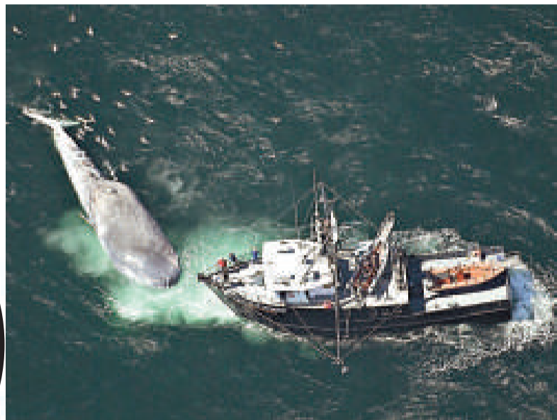
▲研究人員的船隻駛近藍鯨屍體