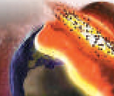
地球可能在數十億年後與水星相撞

科學家推測，隨着太陽老化，它可能會脹大和質量 (mass) 下降，甚至在大約七十億年後對太陽系行星產生重大的影響。屆時地球可能會蒸發；若有另一恆星靠近，則可能被引出太陽系之外。