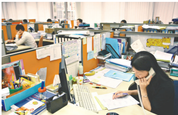
調查顯示勞動市場前景黯淡，應屆畢業生仍面臨大挑戰

另據城市大學管理學系今年3月的調查，市民的就業信心指數4年來首度下跌，受訪者對工作的安全感和前景都感到悲觀。調查訪問大約800名全職僱員，就業信心以10分為滿分計，結果只有5.43分，是2005年以來最低。其中以運輸、倉庫以及通訊業從業員的信心最低，對工作前景的信心下跌至3.25分，而對於晉升機會的信心，則不足3分。