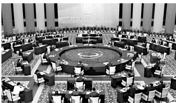
11日，2009年泛珠三角區域合作行政首長聯席會議在內江舉行（新華社）

第六屆泛珠論壇由福建省政府承辦。有專家認為，中國南方這一非常具有開創性的區域經濟合作組織，在兩岸關係不斷獲得突破的形勢下，或有望與台灣對接成功。