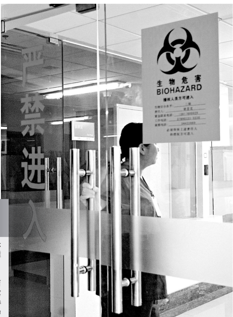
上海分離出兩株甲型H1N1流感病毒並完成全基因組序列測定，圖為成功分離病毒的上海市公共衛生臨床中心應急檢測實驗室（新華社）

6月8日，大連雅立峰生物製藥有限公司從英國生物標準和控制研究所(NBSC)進口了甲型H1N1型流感病毒株。目前，該公司正進行甲型H1N1型流感病毒株傳代的研發工作。只要達到一定的病毒滴度，就可以進行下一步的批量接種工作。該公司預計，如果順利的話，最快可以在7月底前生產出第一批疫苗（新華社）