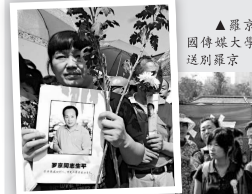
▲一位北京市民手捧白菊花和羅京照片送別羅京

【本報記者賈磊北京十一日電】早前罹患淋巴瘤逝世的央視著名女主播羅京遺體今天火化，告別儀式十一日上午在北京八寶山殯儀館禮堂舉行，過萬名公衆自發前來送別這位「國臉」最後一程。邢寶斌、李瑞英、王寧、康輝、崔永元等眾多央視「名嘴」均身著素服前來弔唁，濮存昕、楊瀾、馮嘉、蔣大為、宋世雄、徐濟成等羅京生前的百餘位各界好友亦到場送別。