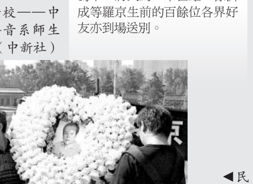
▲民眾自發送別羅京 (本報攝)