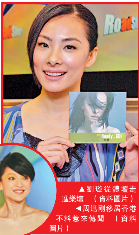
▲劉璇從體壇走進樂壇（資料圖片） ▲周迅剛移居香港不料惹來傳聞（資料圖片）

另外，香港有媒體報道稱，深圳市長許宗衡被中紀委調查，突破口來自一名獲香港居民身份不久的內地著名女星，此人同許宗衡關係密切。媒體總結，近年來以「優才計劃」取得香港居民身份的女明星有周迅、湯唯、章子怡、劉璇、黃奕等多人。周迅年前剛剛獲准拿到香港身份，周迅經紀人對此予以否認，稱周迅根本不認識許宗衡，更談不上交往過甚。