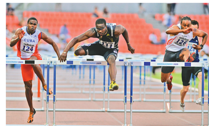
▲羅伯斯(中)在比賽中領先

另訊，北京時間11日凌晨，在國際田聯大獎賽110米跨欄比賽中，傷愈復出的羅伯斯在希臘塞薩洛尼基參加了2009賽季首場室外比賽，以13秒30輕鬆奪得個人2009賽季的首