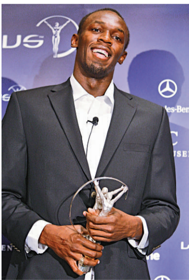
▲博爾特獲勞倫斯最佳男運動員獎

【本報訊】據新浪體育十一日消息：2009年勞倫斯世界體育獎公布了最佳男運動員獎，牙買加田徑運動員博爾特當選，他擊敗的對手包括奧運會上獨得8金的菲比斯，法網和溫網冠軍拿度，世界和歐洲雙料足球先生C朗拿度，最年輕的F1世界冠軍威美頓等人，獲得了這一份量十足的獎項。