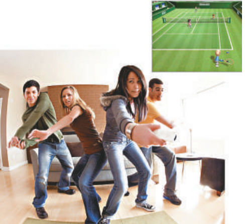
▲任天堂 Wii 遊戲機有助治療帕金森症

戲系統。約六成研究參與者決定要給自己買一部 Wii 了。這能充分說明他們體驗到玩 Wii 有什麼作用。」