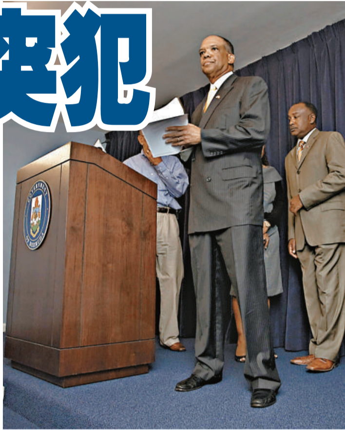
▲百慕大總理布朗十一日在漢密爾頓召開記者招待會