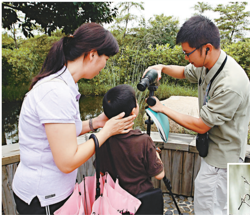
▲導賞員悉心為市民介紹各種不同品種的蜻蜓。由深圳來港遊客說對濕地公園的導賞團感到滿意，認為香港導賞團的引導性較內地多，表示會再來參觀

市民可於即日起至九月三十日到濕地公園參加「蜻蜓節」，了解更多有關蜻蜓和濕地保育的知識。