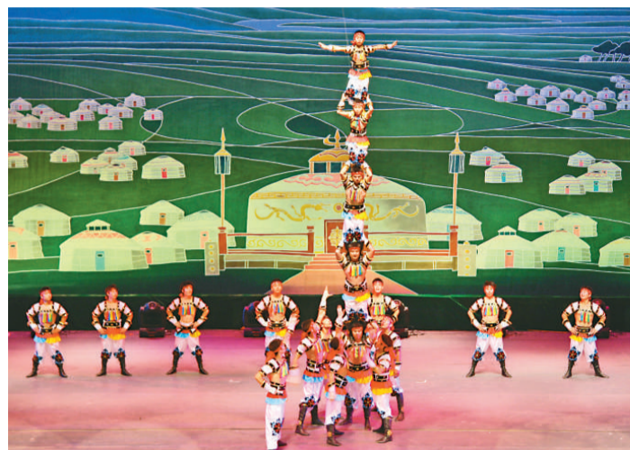
▲疊羅漢表演融合力與技巧，表演者須膽大心細

亂描舍之《夢雨》，將於六月二十七日及二十八日在葵青劇院黑盒劇場演出。門票現於城市電腦售票處發售。