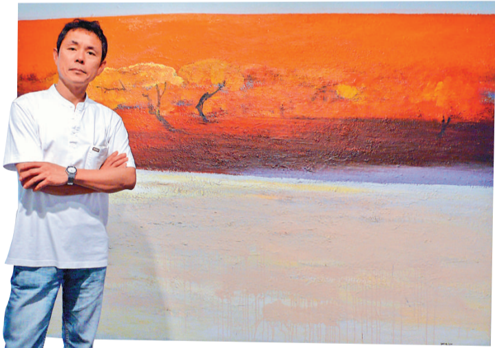
楊登雄畫作傳達着無盡空曠的壯麗色彩