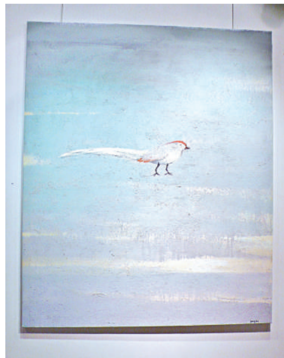
畫中的鳥兒悠然地站着

有走向純抽象風格。他說：「中國跟西方文化背景不同，中國人畫的畫總追求寫意，講求意象，並不能完全地抽象。」在他的作品中出現的各種物件形象，都是一個符號，不論是屹立風中的一棵樹、悠然自在的一隻鳥、盤子上的魚，都有他們的個性和生命，都傾注着藝術家的精神追求。