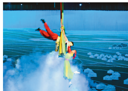
的場面 雜技表演也有浪漫感人的場面