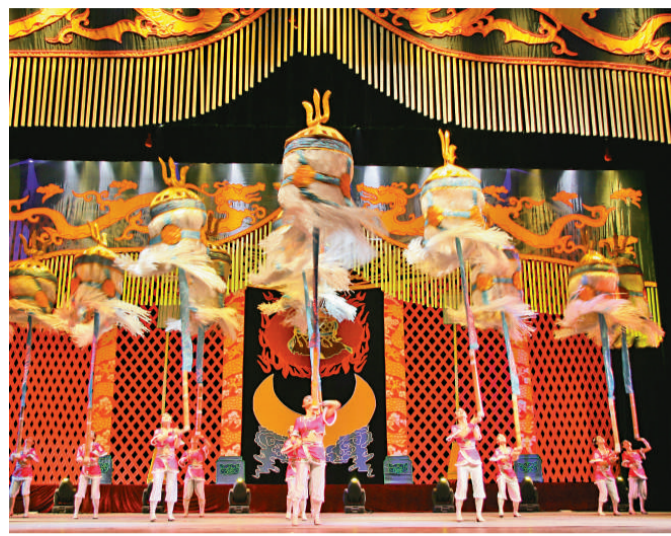
▲驚險又刺激的雜技將為觀眾帶來歡樂

有關「國際綜藝合家歡」節目詳情，可參閱節目指南或瀏覽網址 http://www.hkiac.gov.hk 。