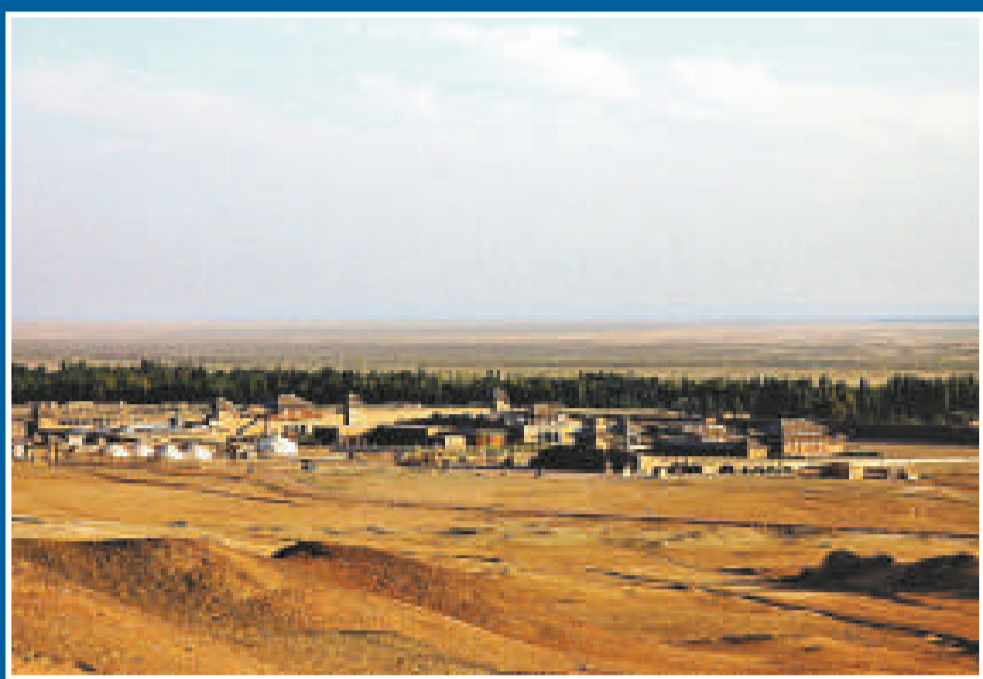
▲河西走廊一度是「絲路」的東方交通要道