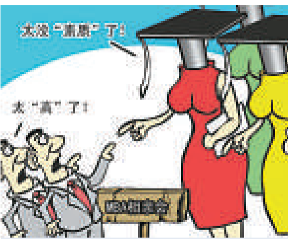
MBA相親一般的要求頗高，男性嫌女性「學歷高」，女性怨男性「素質低」

【本報訊】據《北京晚報》15日報道，北京國際雕塑公園上週六舉行了一場近千人的相親交友活動，有400多名高校在職MBA學員加入，吸引了大批社會人士踴躍報名參加。