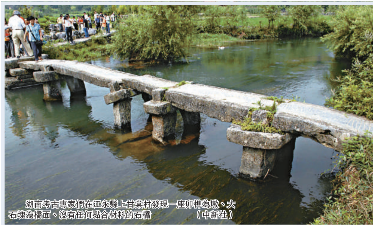
湖南考古專家們在江永縣上甘棠村發現一座卯榫為墩、大石塊為橋面、沒有任何黏合材料的石橋

第四，要有信心。並不是所有的付出都會得到承認，但不付出肯定得不到承認。無論何時，都必須堅信，天道酬勤，天道酬誠，對於勤奮的人，對於誠實的人，世界是不會永遠沉默的。