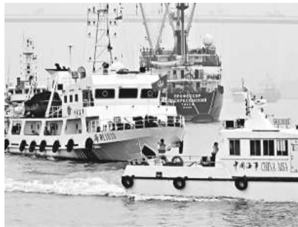
世博水城應急掃測演習十五日在黃浦江世博園區水域舉行

據介紹，人民日報將以這次擴版為契機，更好地堅持「高舉旗幟、圍繞大局、服務人民、改革創新」的總要求，在落實「三貼近」和辦出特色上下工夫，努力改進文風，豐富內容，發揮宣傳黨的主張、弘揚社會正氣、通達社情民意、引導社會熱點、疏導公眾情緒、搞好輿論監督的重要作用。