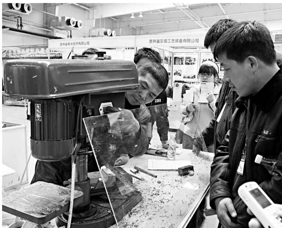
針對中國裝備製造業在「四萬億」招標採購中存在歧視問題，國家發改委將會同國務院有關部門，研究起草政策文件，維護公平競爭的招投標市場環境。圖為長春國際工業裝備展覽會今年三月在長春會展中心舉行。（資料圖片）

《中國經濟周刊》從國家發改委了解到，下一步，國家發改委將會同國務院有關部門，專門研究起草有關政策文件，堅決制止限制國產設備使用做法，維護公平競爭的招投標市場環境。