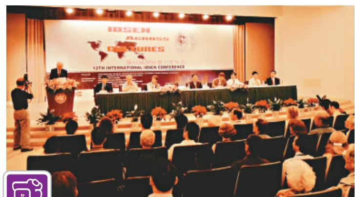
國際易卜生年會在復旦大學開幕 (本報攝)

【本報訊】記者張帆上海報導：第十二屆國際易卜生年會日前在復旦大學開幕。會議由易卜生國際委員會主辦，復旦大學外文學院和復旦大學北歐文學研究中心承辦，會期五天。這是易卜生國際年會首次在亞洲地區召開，這對於推動我國乃至亞洲的易卜生研究將產生重大的影響。