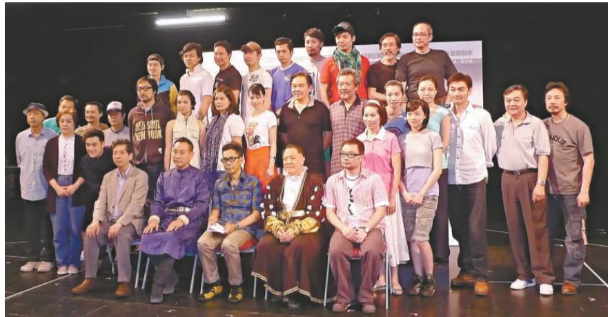
話劇團今次動員三十多位演員演出《李察三世》 (本報攝)

演還設計了不同的死法，其中白金漢被處決的一幕將十分殘忍，導演並要求所有殺人場面都要在舞台上呈現。他說：「因為在舞台上呈現，才能讓觀眾看到李察三世內心的黑暗。」