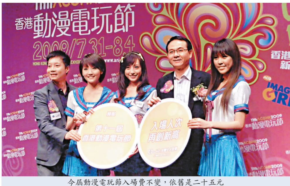
今屆動漫電玩節入場費不變，依舊是二十五元

【本報訊】實習記者區淑玲報導：第十一屆香港動漫電玩節將於下月三十一日，一連五日在灣仔會展舉行。上屆動漫電玩節共吸引約六十萬人入場，預計今年入場人數相若。近來甲流肆虐，主辦單位表示，最壞打算還是押後舉辦或取消。