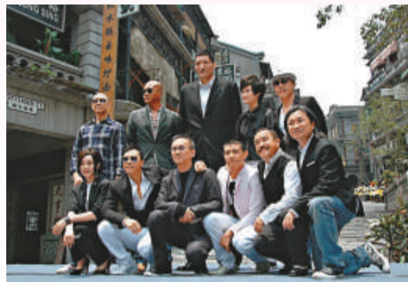
▼范冰冰騎馬有型有款