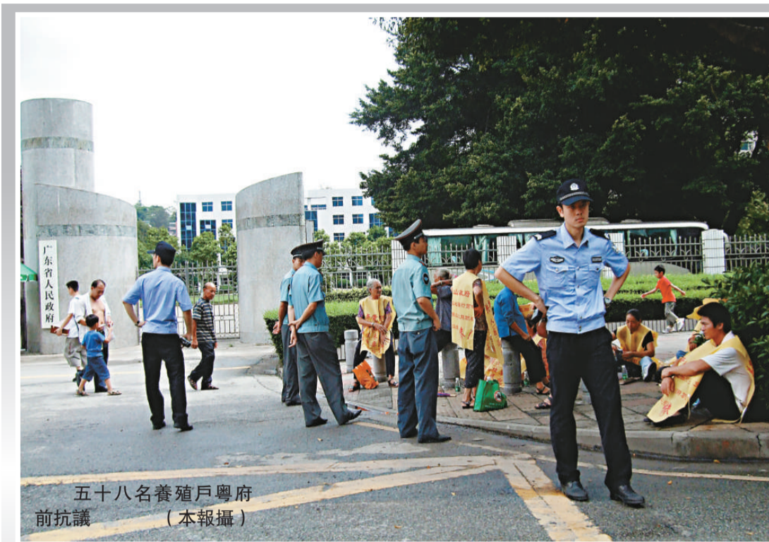
五十八名養殖戶粵府前抗議

記者隨後了解了石龍法庭更改庭審筆錄的情況，據該院的解釋是，由於書記員工作失誤，刪除了錯誤的筆錄，屬於私人行為。目前，該名書記員正在接受調查。法律專家認為，發生在該法庭的擅自更改庭審筆錄事件，暴露了內地基層法院管理混亂的嚴重問題。