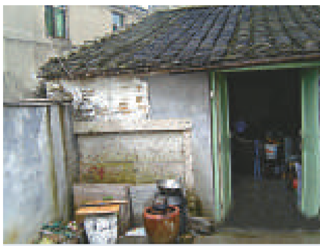
周恩來祖墳的墓碑近日在紹興縣平水鎮四豐村唐家巷被發現砌在村屋牆上。

【本報訊】中國已故總理周恩來祖墳的墓碑，近日在浙江省紹興縣平水鎮四豐村唐家巷被當地一位記者找到。周恩來的侄女周秉宜隨後證實，這塊墓碑是周恩來太高祖、周氏十六世祖周文灝的墳前墓碑，係1977年鄧穎超按照周總理囑託，派人到紹興平去祖墳後留下的墓碑。