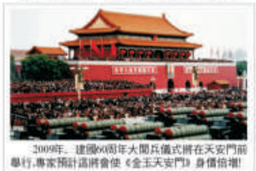
2009年，建國60周年大閱兵儀式將在天安門前舉行，專家預計這將會使《金玉天安門》身价倍增！

海上閱兵的成功舉行，使所有國人對國慶大閱兵更加關注，隨著閱兵式的臨近，天安門作為歷次閱兵儀式的見證聖地，聚集了全世界的目光。《金玉天安門》作為國力鼎盛、民族富強的象征，世紀大閱兵的永久見證，衆人的收藏熱情一再高漲，各發行中心的預定人數一再增加！