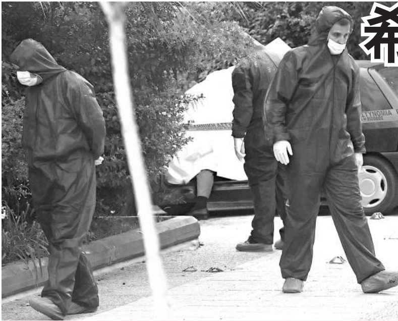
調查人員十七日在事發現場搜集證據