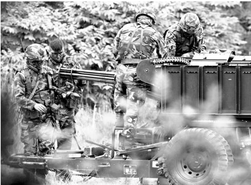
▲韓國士兵十七日檢查裝備準備進行演習，這場軍事演習是針對有可能來自朝鮮的襲擊

當天發表的另一篇評論說，朝鮮加強戰爭遏制力是為了保衛自己的安全。韓國當局大肆宣傳「根本不存在的北方威脅」，目的是轉移輿論焦點和民衆視線，擺脫統治危機。