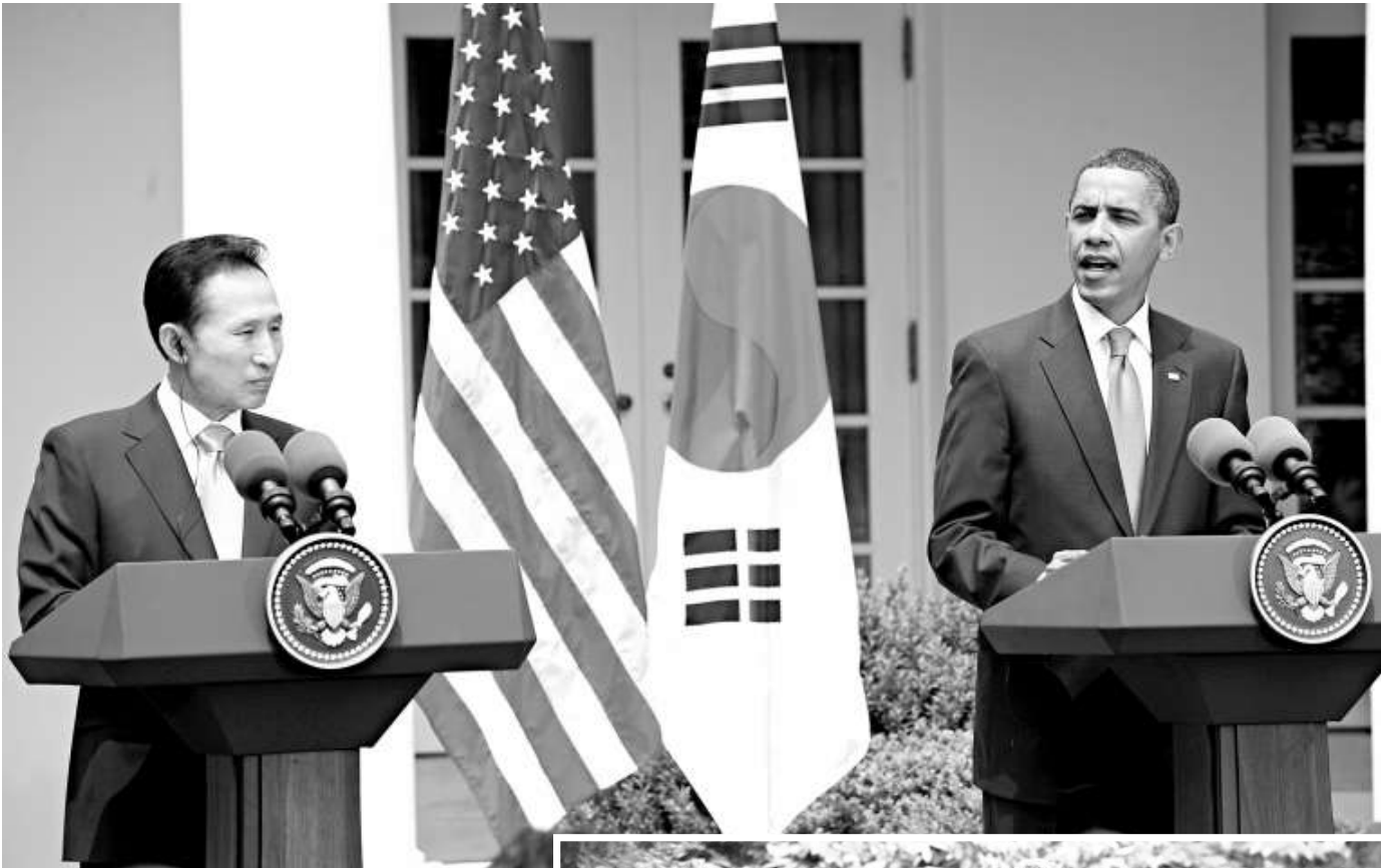
▲韓國總統李明博（左）與美國總統奧巴馬十六日在白宮召開記者會

奧巴馬與李明博在會晤中還就全球經濟危機、清潔能源和可持續發展、美韓自由貿易協定等問題交換了意見。雙方在會晤後發表了聯合聲明，同意深化美韓同盟關係，確保朝鮮半