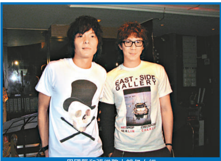
周國賢和張繼聰大談子女經

周國賢表示太太因為擔心流感，所以不打算帶兩位女兒看音樂會，他稱大女兒早前持續發燒，吃了五天抗生素，細女又開始感冒，會減少帶她們出外。