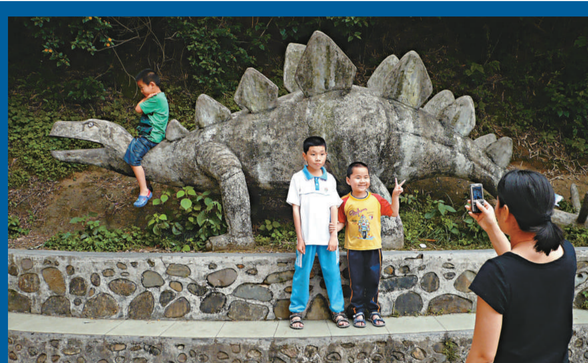
▲在河源恐龍化石文物展覽館內，「石恐龍」吸引不少孩子拍照 ▲恐龍的化石巨大無比

【本報訊】國際學者長期爭論現代鳥類是否由恐龍演進而來，被認為像鳥的恐龍爪上有一三指，現代鳥類翅膀骨骼則有祖先前肢三指——此三指是否等於彼三指，科學界多年來爭論不休。中國科學家牽頭的一個國際研究小組率先找到了兩者存在親緣關係的新證據。