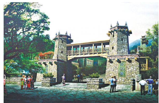
北川園畫顯北川羌族園林特色

本屆「園博會」是第一次在非沿海城市舉辦，但有着「泉城」盛名的濟南卻做足了水文章，在設計上注重水元素的運用。在園博園裡，「生命之源——水」是整個環境的構思出發點，為此設計了專門的觀水平台。在中央湖區，還提供了水上遊船路線。泉韻廣場中央的「水之門」別具特色，利用水幕顯示「有朋自遠方來不亦樂乎」的歡迎字體。據說，這個大型半圓水幕構築物，呈現的效果可與水立方相媲美，確實令人期待。【本報記者 王志刚】