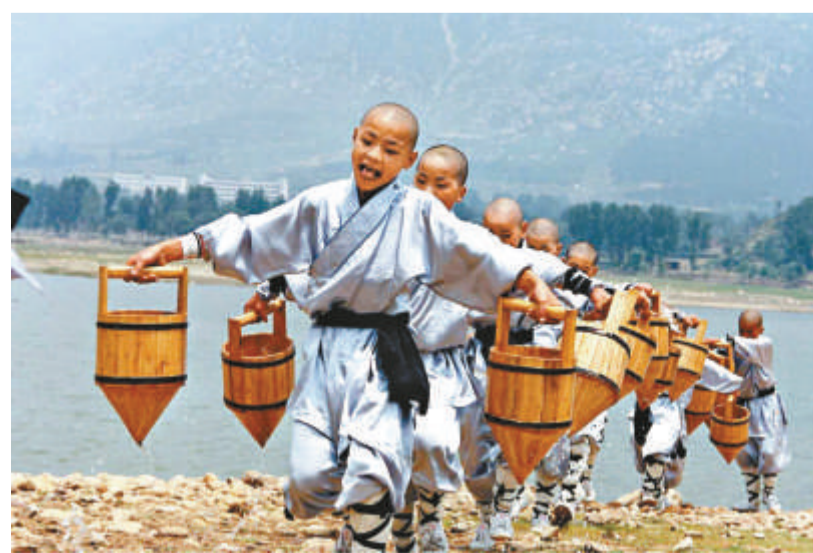
少林寺的小沙彌在提水 (資料圖片)

讀者所熟悉的少林武僧團，在國內和海外四處演出，那些少林武僧為少林寺賺了不少演出費。他們雖是皈依佛門的和尚，卻是