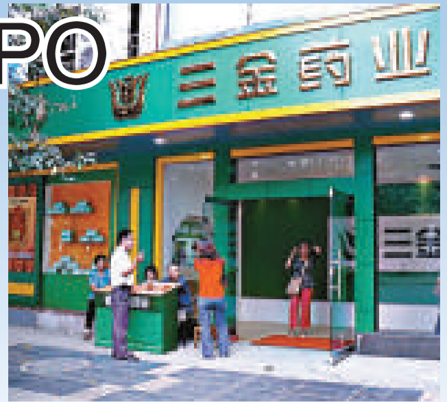
桂林三金藥業昨日獲得IPO（首次公開發行股票）發行批文

三金藥業的兩個拳頭產品，一個是西瓜霜系列，居內地喉科類中成藥市場第一位，第二個是三金片系列，市場佔有率也居內地抗泌尿系感染中成藥市場的第一位。三金藥業是唯一一家品牌中藥企業中還未上市的企业。