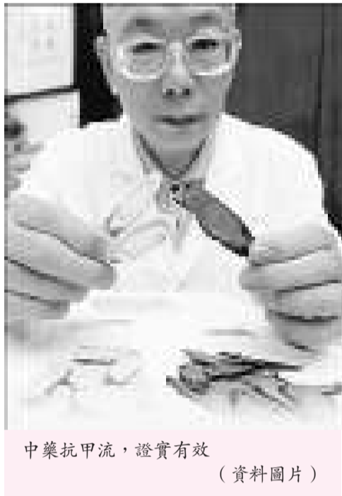
中藥抗甲流，證實有效（資料圖片）