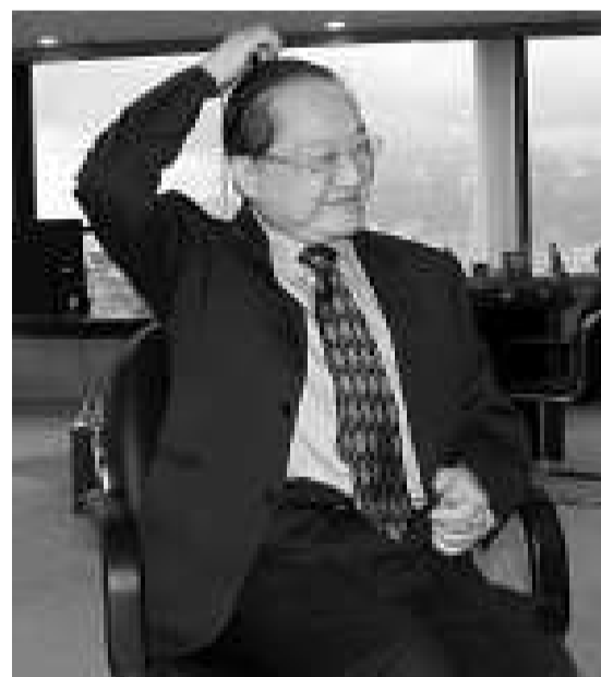
金庸作品風靡華人社會（資料圖片）

【本報訊】著名香港作家金庸或將在月底正式加入中國作協，中國作家協會已將其列入二零零九年度擬發展新會員名單。