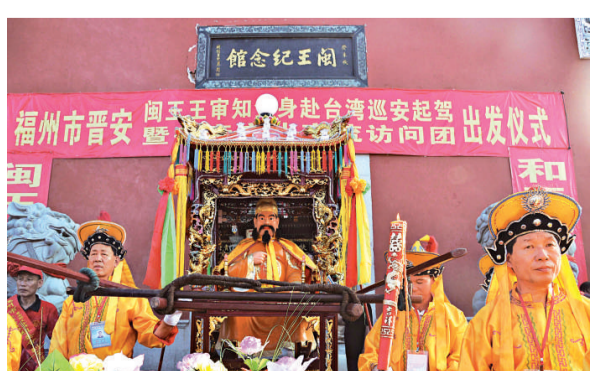
福州王氏宗親護送閩王金身前往馬尾搭船赴台巡安

資料顯示，王審知（862年—925年），光州固始（今河南省固始縣）人。治閩期間，為唐末五代時期福建的社會安定繁榮，經濟文化的建設發展做出顯著成績，被福建人民尊稱為「開閩第一人」、「八閩人祖」。