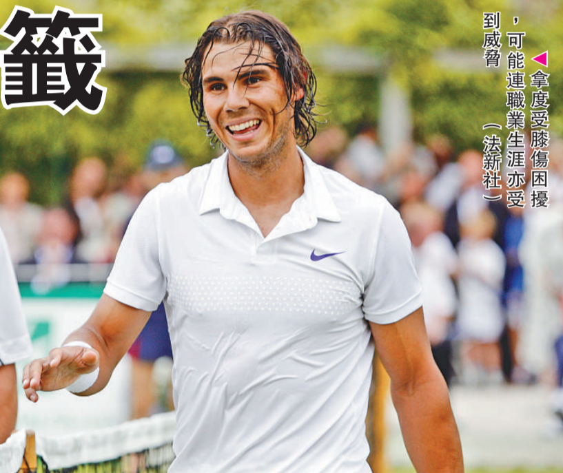
▲拿度受傷困擾，可能連職業生涯亦受影響