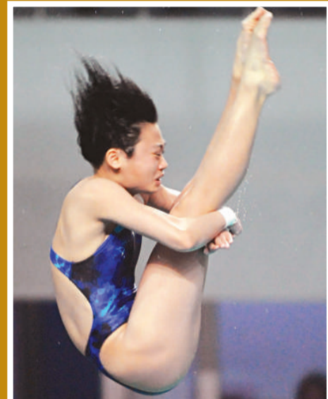
▲勞麗詩曾在雅典奧運會獲跳水金牌（資料圖片）