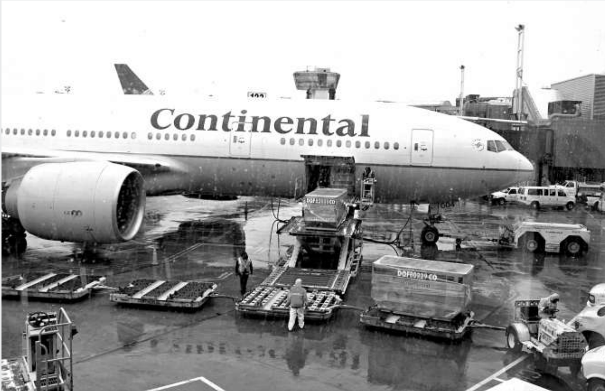
美國大陸航空公司客機十八日安全降落在紐約紐瓦克機場

前艙飛行機師是飛行安全的核心，航空業甚至會小心到規定前艙組員在飛行途中用餐時，必須吃不同的主餐，萬一出現食物中毒，也只有一名飛行員不能執行任務，無礙飛行安全。