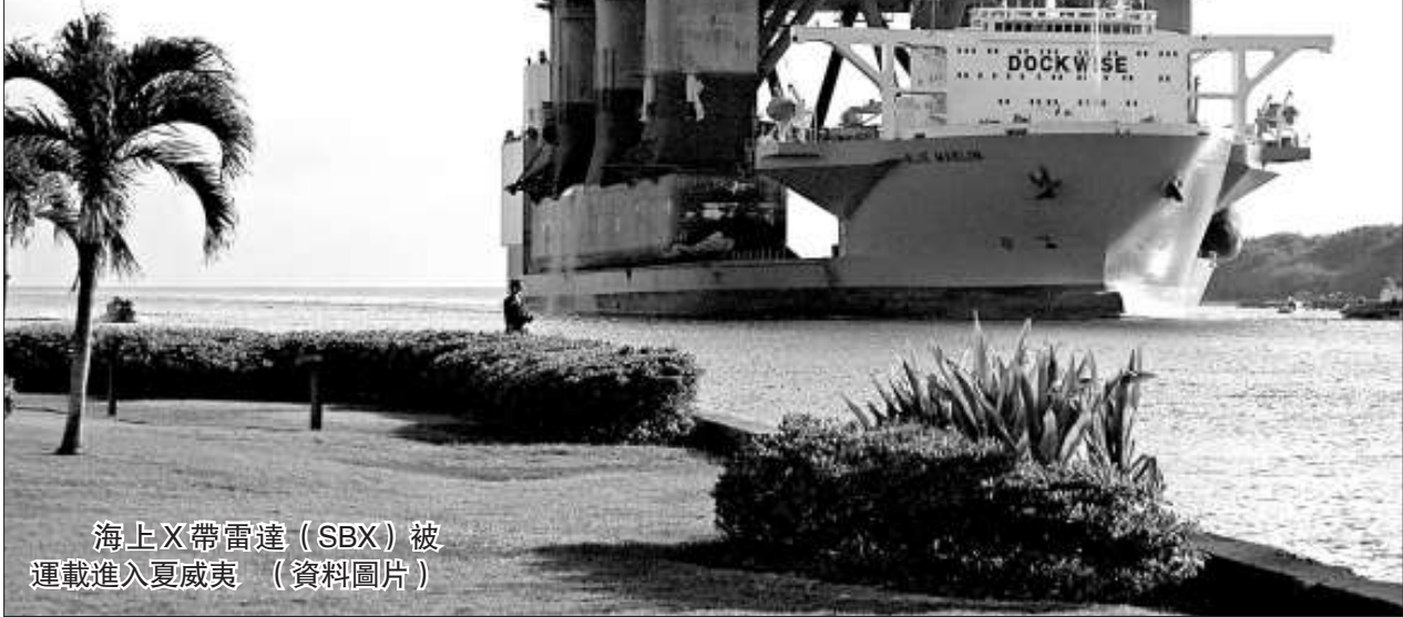
海上X帶雷達（SBX）被運載進入夏威夷（資料圖片）

遠程導彈的一處發射基地有活動。本月早些時候訪問馬尼拉時，蓋茨表示美國已經發現一些跡象顯示朝鮮正在準備發射一枚遠程導彈。但他又說，目前還不清楚朝鮮打算做什麼。