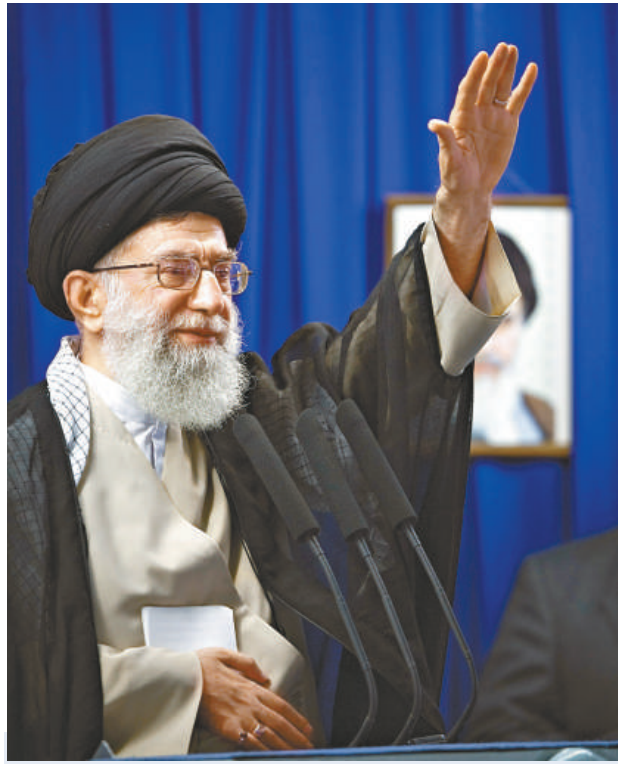
伊朗最高領袖哈梅內伊十九日在德黑蘭主持祈禱會

【本報訊】綜合通訊社十九日消息：伊朗最高領袖哈梅內伊星期五在首都德黑蘭主持祈禱會，他呼籲結束因不滿意總統選舉結果而持續一周的街頭抗議，又表態支持勝出的總統內賈德，指摘敵國動搖人民對體制的信心。