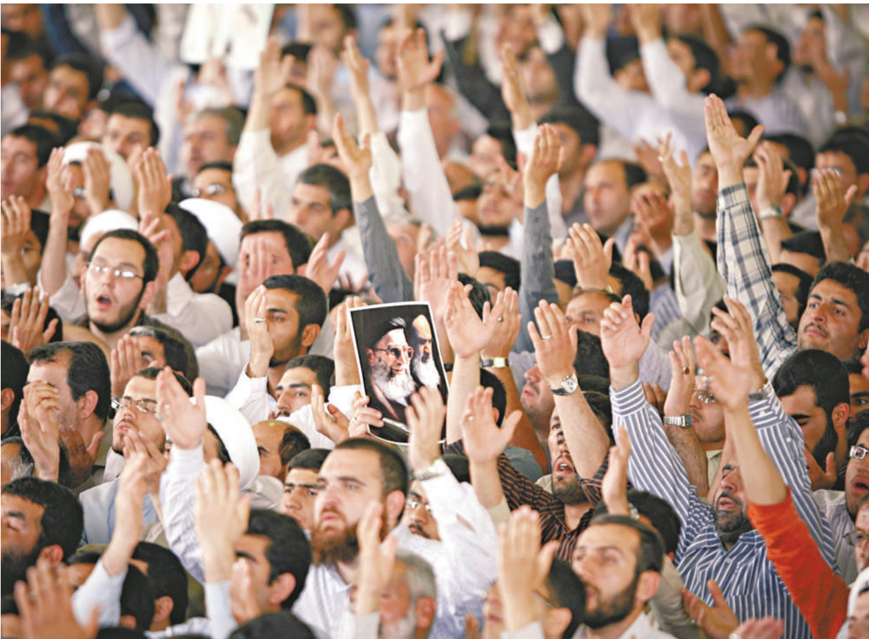
數萬民眾參加了在德黑蘭大學舉行的祈禱會