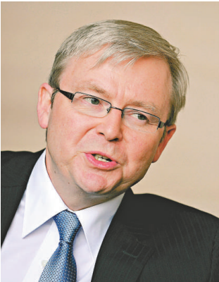
陸克文面臨上任以來最大危機

【本報訊】據法新社悉尼十九日消息：澳洲總理陸克文十九日面對他上任十八個月以來最大危機。參議院的調查中發現有證據顯示他向議會說謊。