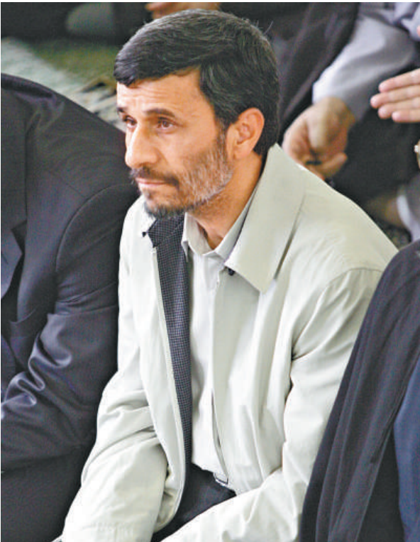
伊朗總統內賈德仔細聆聽哈梅內伊的演講

按照原定計劃，反對派將於星期六在德黑蘭舉行一場大型集會，其間穆薩維將會發表講話。但當局表示，該場集會並未獲得政府授權，屬於非法。而另一名總統選舉候選人、前議長卡魯比日前呼籲支持者不要出席哈梅內伊的新禱會，以免與親政府的民眾發生衝突。