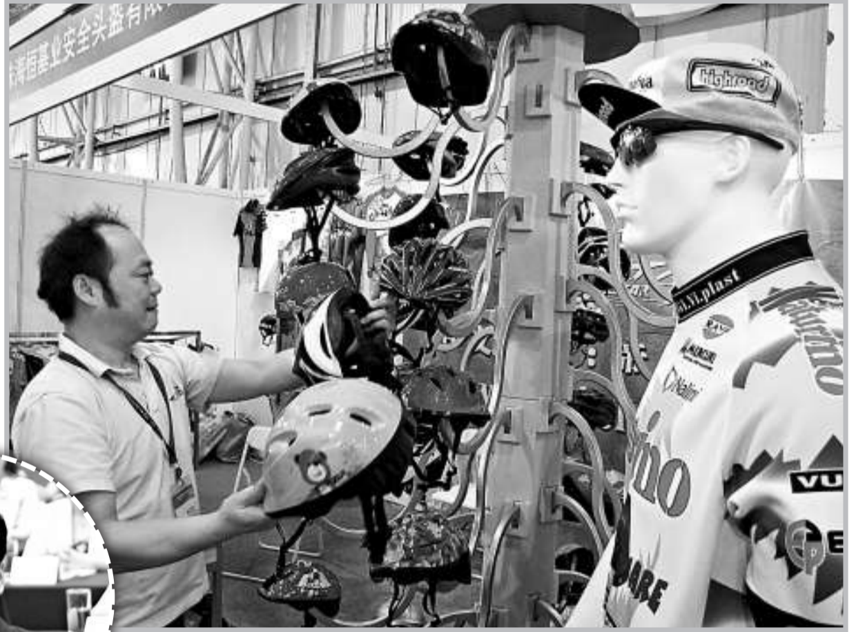
▲廣東外博會上不少參展企業稱電子商務簡單快捷且成本小，將成為出口企業切入內銷的重要途徑

另外，記者在外博會上獲悉，為扶助企業應用電子商務應對經濟寒冬，東莞市政府與另一網絡銷售巨頭「阿里巴巴」簽訂《框架協議》。根據協議，東莞未來三年將投資發展電子商務，由阿里巴巴向東莞企業提供電子商務培訓、針對中小企業的網絡聯貸及外貿人才聯合培養服務。企業投入的一半費用由政府買單，一家企業一年最高能獲得15萬元。主管外經貿工作的東莞副市長江凌透露，本次合作將有1.2萬家東莞企業受惠，其中港企佔了六成。