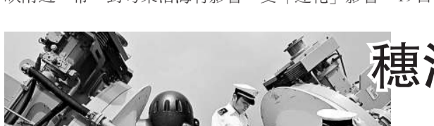
廣州海關對敏感進口商品加強分析核查

氣象部門監測顯示，今年第三號熱帶風暴「蓮花」中心附近最大風力八級，達到18米每秒的風速。預計未來兩天，「蓮花」將緩慢向偏東北方向移動，逐漸移向台灣海峽附近一帶，對粵東沿海有影響。受「蓮花」影響，19日下午5點，廣東汕頭、汕尾、潮州、揭陽等地12個縣市陸續降臨颶風警報。