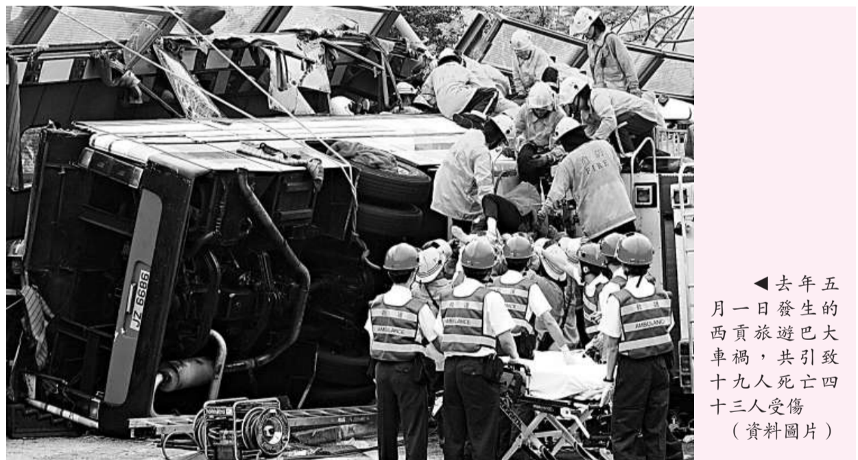
去年五月一日發生的西貢旅遊大巴車禍，共引致十九人死亡四十三人受傷 (資料圖片)

旅巴其後在高速下左搖右擺。乘客隨後聞到燒焦味道，乘客大驚失色，但被告沒有停車，最終旅巴輪胎冒煙，並在迴旋處翻側，撞向一支燈柱及混凝土柱，再撞向隔音屏。被告其後爬出車並向到場警員表示旅巴煞車掣失靈。