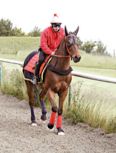
「蓮華生輝」未能再為港爭光 (資料圖片)

【本報訊】香港時間昨晚在英國雅士谷馬場舉行的金禧錦標(國際一級賽)1200米，目前世界草地短途評分最高賽駒的香港代表「蓮華生輝」，在柏實出策之下只能跑第5，未能再為港爭光。爆冷跑第1是「鑑賞家」，跑第2是「炮彈」，跑第3是「謙受益」，跑第4是「卡通飛機」。