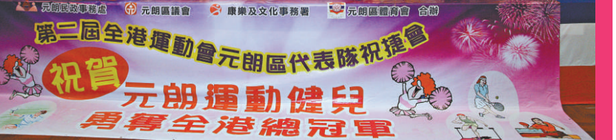
元朗區各支隊伍的運動員、啦啦隊與嘉賓齊濟一堂