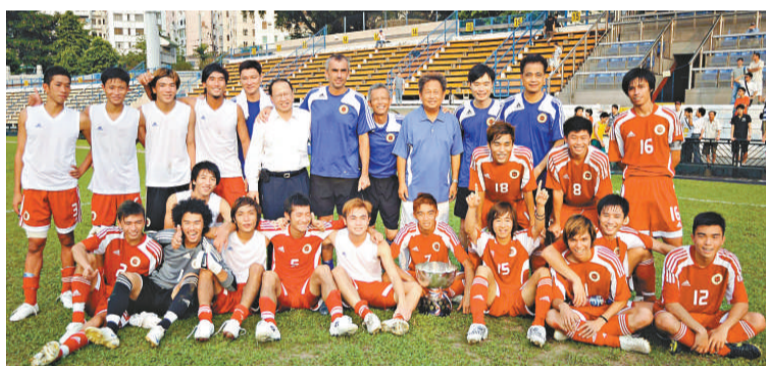
香港隊連續 11 屆在港澳埠際賽捧杯

【本報訊】昨午的第65屆港澳埠際賽成為旺角場重建前最後一場國際賽，主場出戰的香港東亞運集訓隊雖因大意犯錯一度被追近至1:2，但下半场以眾凌寡下仍以5:1擊敗澳門代表隊，連續11屆捧杯。