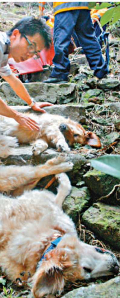
▲兩頭金毛犬奄奄一息 (本報攝)