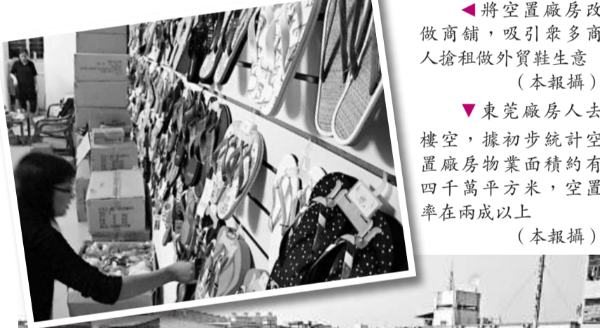
將空置廠房改做商舖，吸引眾多商人搶租做外賣鞋生意