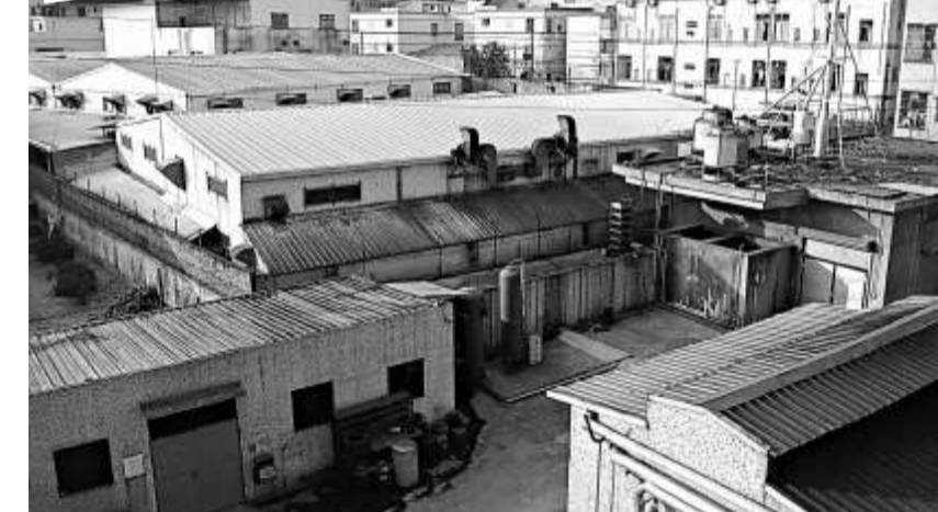
東莞廠房人去樓空，據初步統計空置廠房物業面積約有四千萬平方米，空置率在兩成以上