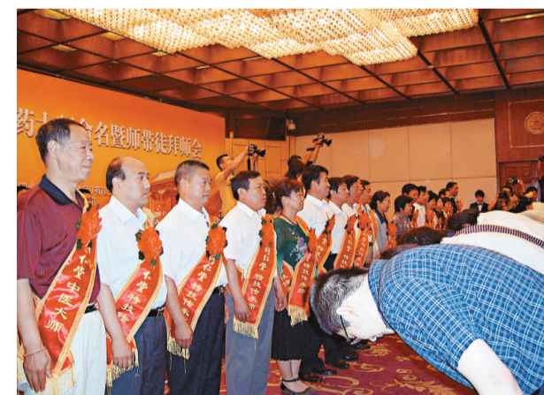
54位徒弟向師傅行拜師禮

據介紹，同仁堂「師帶徒」的傳統培養方式，使同仁堂絕活絕技、精湛的工藝得以延續。建國初期至今，同仁堂共舉辦師徒班50多期，有1000多人次拜師學藝。