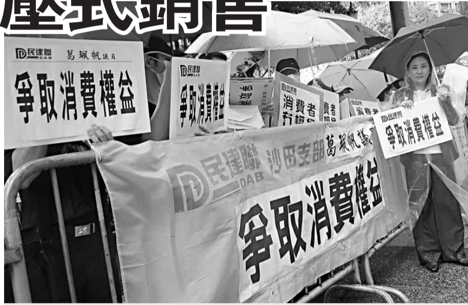
民建聯昨到立法會請願，要求對不良銷售手法作出監管 (本報攝)

商務及經濟發展局副局長蘇錦樑回應說，政府未來會就保障消費者展開多項工作，包括加強多項條例的執法工作，推行更多宣傳及公眾教育。他表示，政府不否定會制訂跨行業條例，但由於涉及多方面因素，例如需增新的執法機構及裁判處，情況複雜，需要展開廣泛諮詢，預計最快今年年底會出新的相關建議。