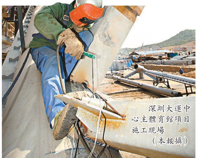
深圳大運中心主體育館項目施工現場