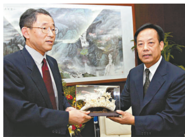
▲東莞市長李毓全（右）向吉田雅治贈送紀念品

至於企業最為關心的「最低工資標準會否提高」，江凌稱這是由廣東省裡決定的，東莞無權提高或降低標準。不過鑑於當前企業的困難，東莞早就向省裡反映情況並希望近期內不要調高。針對現存的口岸基礎設施建設專用資金、污水處理費等幾種行政事業收費問題，江凌坦言，口岸建設費是東莞比較特殊的費用，廣東其他城市確實沒有。收費的同時可提高通關效率，這是當年政府與企業達成的共識。不過考慮到企業現在的困難，東莞已作出決定逐步取消這項收費，今年按以往的九成收取，重點企業則按