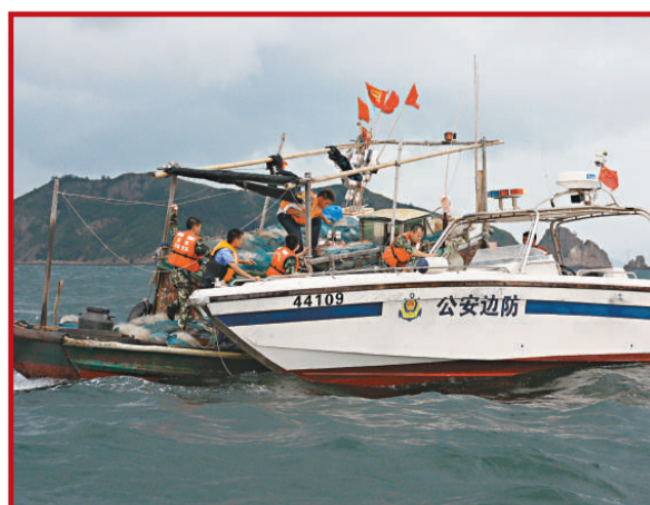
▲一艘漁船昨日在大亞灣大嶼島附近海域因船體破裂進水遇險，深圳邊防支隊龍崗大隊東山站官兵接警後與當地漁政人員迅速趕赴事發海域救援，4名遇險漁民成功獲救

江凌還向吉田雅治介紹目前東莞的經濟狀況時表示，目前總體發展趨勢向好，儘管進出口仍處下行狀態，但降幅已連續五個月在逐步收窄。對於東莞年初制訂的10%的經濟增長目標，江凌稱「我感覺還是比較有可能實現」。