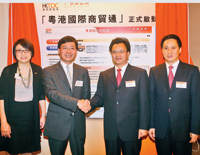
◀出席開通儀式的廣東省副省長萬慶良(右二)及貿發局總裁林天福(左二)等合照

出席開通儀式的貿發局刊物及電子商貿總監黃思慧表示，此次與廣東方面的合作，讓港商不但可以及時了解廣東省政府的服務措施和最新市場資訊，還可透過網站的政策諮詢服務，在七個工作天內獲取廣東省政府有關部門解答有關投資貿易政策的查詢，而本港服務供應商亦可透過這網站，推廣服務予廣東企業。