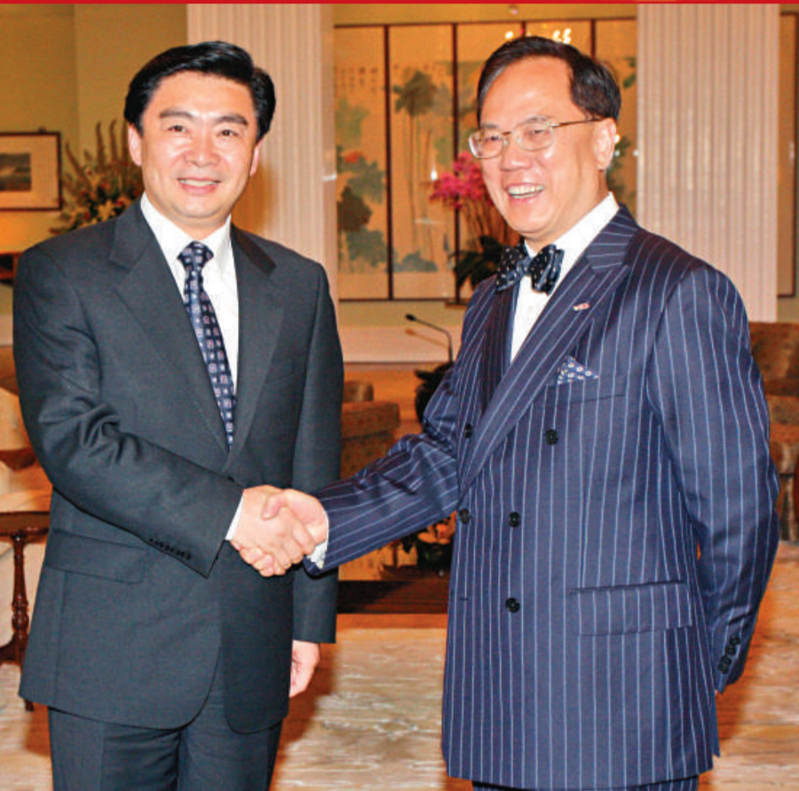
▲特首曾蔭權(右)在禮賓府會見深圳市代市長王榮

履新不足半月的深圳代市長王榮昨日率團訪港，並與行政長官曾蔭權、政務司司長唐英年會面。王榮強調，深圳會以學習香港、服務香港，落實深港合作促進兩地繁榮為理念，一如以往把所有工作做好；而在「一國兩制」方針指引下，深圳根據粵港合作框架、深港合作協議推進兩地合作會有三「不變」，即目標、決心、力度均不會改變。