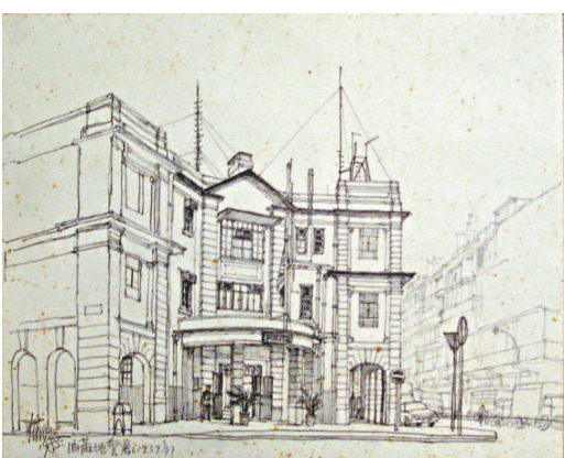
江啓明筆下的油麻地警署，1985，素描

展覽：香港今昔——江啓明素描展 展期：即日起至七月二日 時間：上午十一時至下午九時 地點：海港城·美術館 查詢電話：29888278