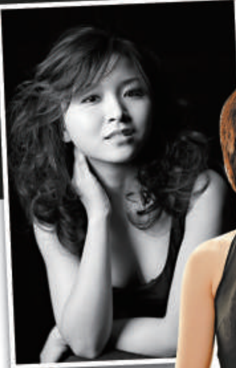
▲中國鋼琴家陳潔 ▲中國小提琴家楊天嬌