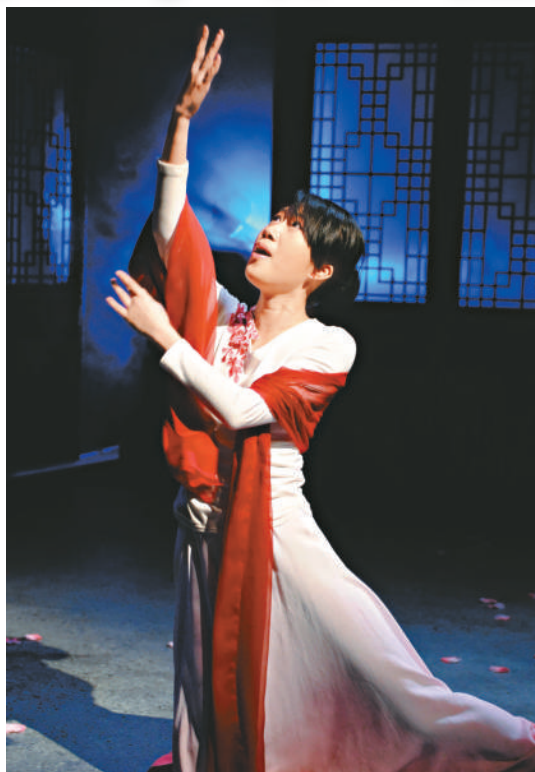
李慧娘香魂未散，與秀才裴禹再續前緣

《只有香如故》乃康樂及文化事務署主辦的大型暑期藝術節「國際綜藝合家歡」，其中新人類系列的節目之一，將於七月十七至十八日，晚上七時三十分，及七月十八至十九日下午三時在香港文化中心劇場上演。門票於各城市電腦售票處發售。查詢可電二三七〇一〇四四。