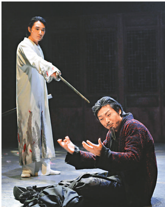
《只有香如故》改編自明朝著名曲本《紅梅記》