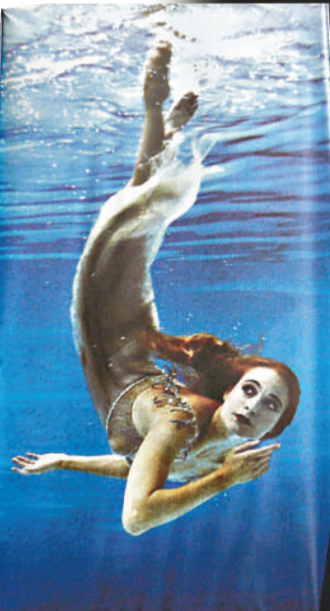
▲大幅《水妖安典》舞劇海報掛於皇家歌劇院外牆

男主角帕萊蒙和女主角貝特的舞蹈編排則被批評為流於單一及表面化，兩個人物的性格缺乏立體感。艾斯頓眼裡似乎只看見瑪歌芳婷，沒有花太多心思去完善其他角色的戲份及舞段。此外，劇情開展多處出現不合情理的地方