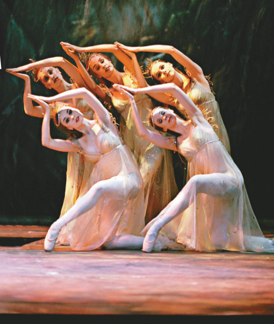
▼《水妖安典》群舞演員猶如波浪流動的舞姿

。譬如說，第二幕帕萊蒙與安典為何乘船出海？他們前赴何處？貝特又怎會無緣無故緊隨他倆同坐一船？再者，第三幕一開始便展現帕萊蒙跟貝特張羅婚禮慶典，完全沒有交代沉船後的情況。帕萊蒙為何會移情別戀？安典下落如何？凡此種種，皆致觀眾感到情節的安排欠妥當。