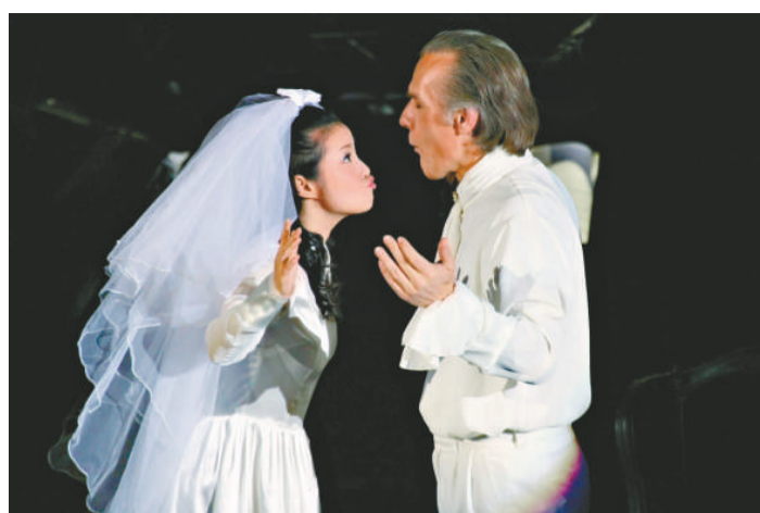
▲《費加羅的婚禮》劇照