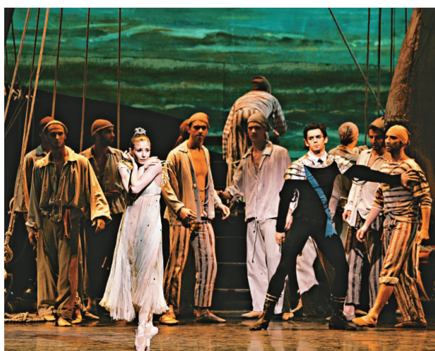
▲眾船員排擠安典，令她深感困惑

自此，《水妖安典》再被列為經常公演的保留劇目之一。經過多次重演，大眾的反應亦產生了變化。現今的舞