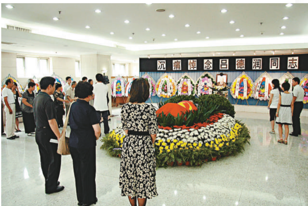
呂德潤遺體告別，社會各界致哀

，在推動港澳回歸、海峽兩岸和平統一等做了許多工作。1990年，台灣當局禁止大陸記者訪台。呂德潤通過中新社發表談話，呼籲台灣當局放寬對大陸記者對台採訪的限制，提出應當在新聞界實行雙向交流。這項頗具前瞻性和開拓性的倡議見諸報刊後，引起人民日報海外版、港台地區及東南亞等地華文報刊的報道，引起較大反響。1986年9月，呂德潤被任命為國務院參事。他提出了若干富有前瞻性、建設性和可操作性的建議，先後得到了李鵬、朱鎔基、溫家寶等三任國務院總理的重視和肯定。