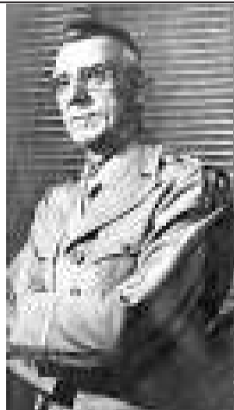
史迪威將軍 (資料圖片)