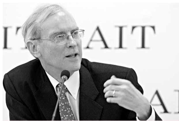
楊甦棟昨日表示，美對協助台灣防衛，相關軍售的想法未改變

【本報訊】據中評社台北二十六日報道：任期即將屆滿的美國在台協會(AIT)台北辦事處處長楊甦棟今天舉行告別記者會。對於馬英九上台後，努力改善兩岸關係，楊甦棟予以肯定。