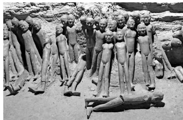
漢陽陵出土的著衣式陶俑將赴台展出

展出中，著衣式陶俑是最獨特的一類，常被稱作「裸體俑」，包括了武士俑、宦官俑、侍女俑及騎兵俑。這些俑通體施有橙紅色彩繪，頭髮、眉毛、瞳仁、鬚鬚均呈黑色，且出土時均為裸體。專家解釋，這些陶俑原本安裝有可以活動的木質手臂，身穿絲質和麻質的服飾，由於深埋地下、年代久遠，致使衣服腐朽、木臂成灰，出土時均為裸體缺臂。同時由於這些漢俑個頭均為五、六十厘米，比