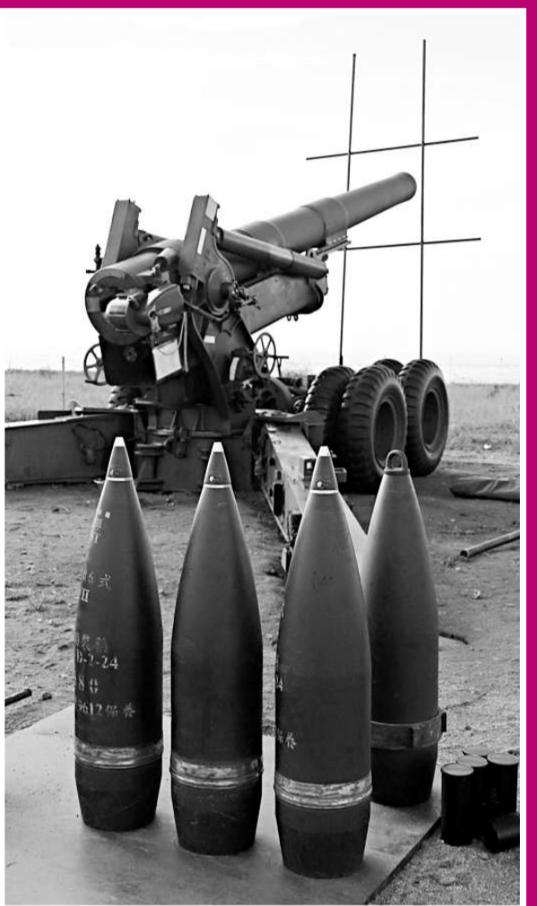
▲金防部昨日軍演被迫縮小規模，這門參演八吋榴炮被迫熄火，一彈未發