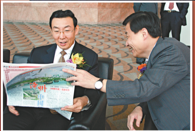
福建省常委、宣傳部部長唐國忠（左）在香港「海西先行新風采」圖片展會場閱讀本報相關報道，右為福建省文化廳廳長宋閩旺