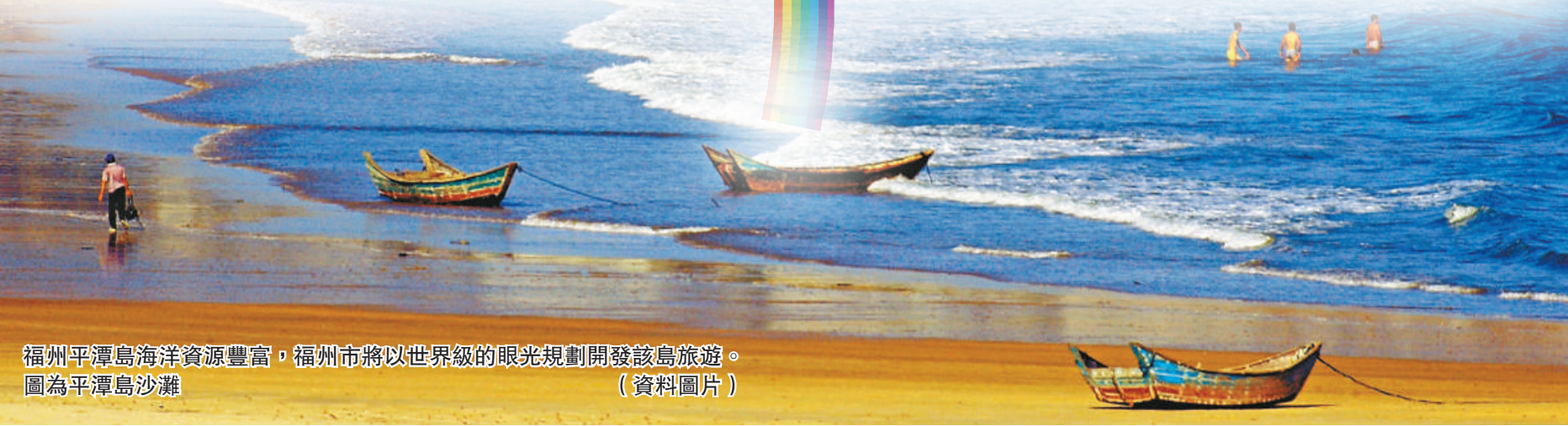
福州平潭島海洋資源豐富，福州市將以世界級的眼光規劃開發該島旅遊。 圖為平潭島沙灘 (資料圖片)