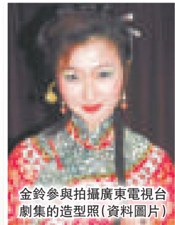
金鈴參與拍攝廣東電視台劇集的造型照（資料圖片）