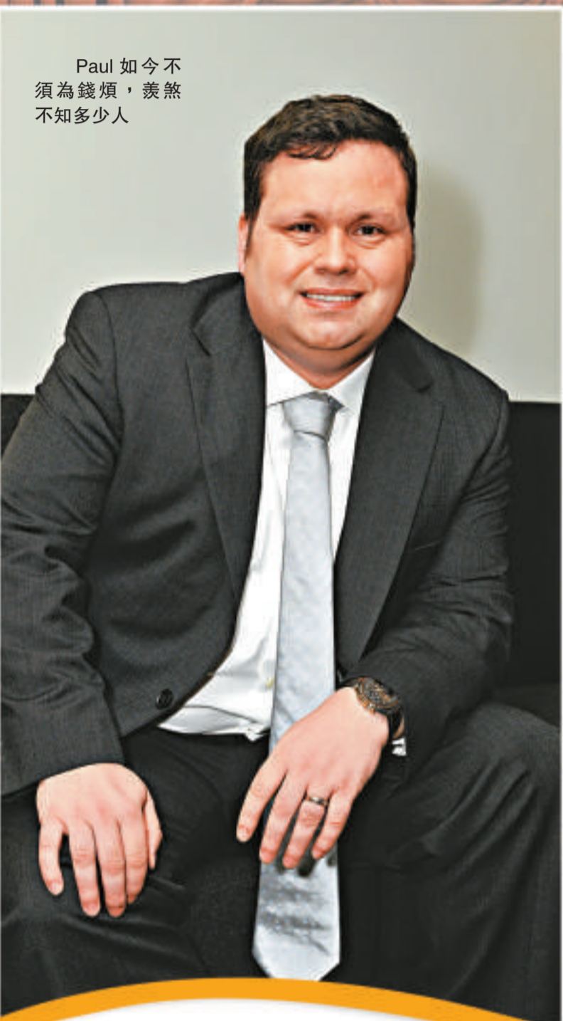
Paul 如今不須為錢煩，羨煞不知多少人

Paul Potts，一個特別的名字，是夢想成真的代名詞，也證明了林林總總的才藝比賽，其實可以不只是為博觀眾一笑。一夜成名背後，Paul Potts 用自己的實力延續奇蹟，如今，他的第二張專輯《Passione》面世了；公眾審視他的眼光依舊有着分歧，但他很清楚他所走過的路，懂得為終於能夠從事自己喜歡的歌唱事業而感恩，是以能在訪問中笑着名利，坦言自己仍是兩年上台參賽的那個無名小子，熱情未變。