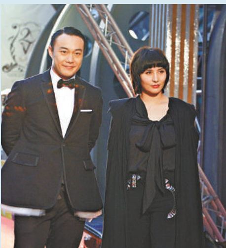
▲陳奕迅（左）別致服飾出席金曲獎，旁為何超儀