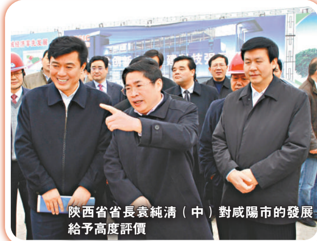
陝西省省長袁純清（中）對咸陽市的發展給予高度評價