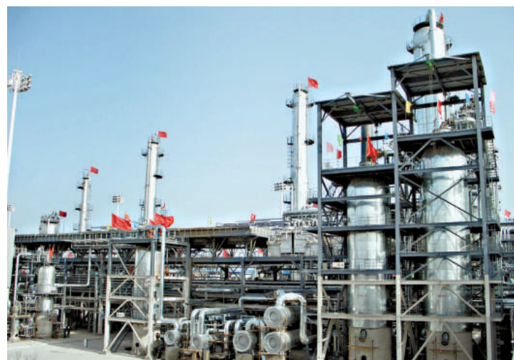
在大項目的支撐下，咸陽工業迎來新跨越。圖為年產120萬噸加氫裂化裝置投產

如此看來，咸陽市近年來的發展變化，並不僅僅是工業經濟的增長、城市面貌的變化以及人均GDP的提高，更是城市綜合競爭力的快速提升。正如陝西省省長袁純清日前評價的那樣：近年來，咸陽市緊緊抓住推進西咸一體化的機遇，解放思想，開闊眼界，以開放的胸懷主動融入西咸一體化經濟圈，努力擴大招商引資，已經開始步入工業化道路，發展前景非常廣闊。