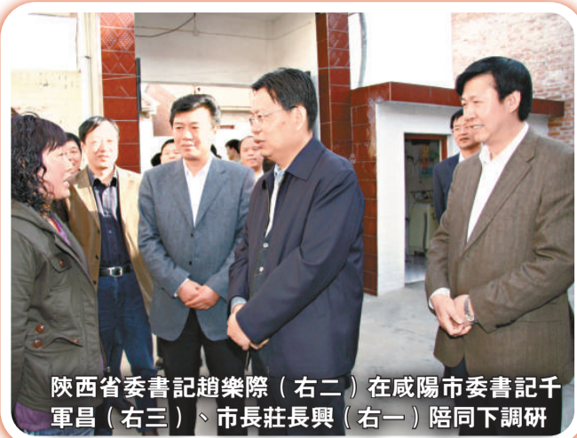
陝西省委書記趙樂際（右二）在咸陽市委書記千軍昌（右三）、市長莊長興（右一）陪同下調研

西部，陝西咸陽——這一曾孕育了中華農耕文明的千年帝都，近年來因嚴格遵循客觀規律和經濟學理論，不斷傳承，勇於創新，經濟總量迅速翻番，並嬗變轉型邁上工業化道路，為西部欠發達地區經濟發展作出了示範。 雷永剛