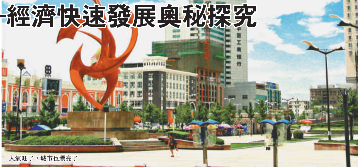
人氣旺了，城市也漂亮了

「咸陽市GDP現在還不到800億，而這些即將建成的企業，一戶年產值就是百億左右，可以想像對咸陽經濟是多大的拉動！」市工業辦幹部介紹時無不