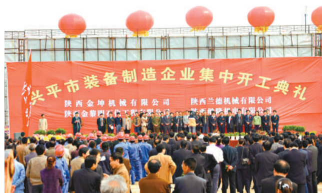
大型項目頻頻落戶