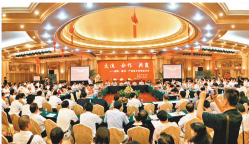
外出招商總是人氣旺旺

2003年至今已6年多的時間，咸陽市招商的理念和實施方式，也在實踐中依照客觀規律和當地實際而不斷調整完善。最初階段的招商是摸着石頭過河的，大小項目兼顧，但卻讓咸陽幹部的思想觀念發生了巨大轉折和提升。之後，隨着思想觀念的不斷成熟，咸陽市提出並實施了「三個轉變」：由大招商向招商轉變，着力引進投資規模大、帶動作用強的項目；由重數量向重質量轉變，重視項目的科技含量、經濟效益、對財政的貢獻等；由招商引資向選商引資轉變，看是否有污染、是否符合產業政策。最近兩三年，又開始實施「科學招商、理性招商、綠色招商、效益招商」。