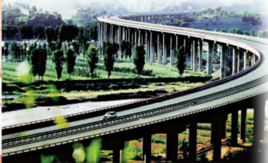
咸陽作為西部交通樞紐的地位愈發凸顯，圖為福(州)銀(川)高速公路