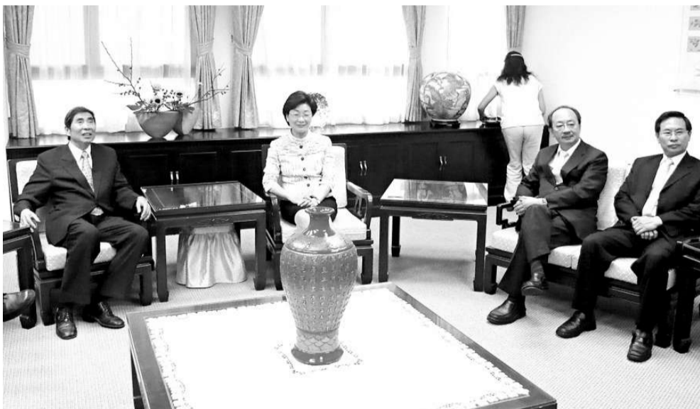
民進黨「立法院」黨團三長二十九日拜會法務部長王清峰（左二），針對陳水扁司法案件等交換意見

【本報訊】台北二十九日消息：中社報導，民進黨二十八日召開「對話與共識會議」，黨主席蔡英文會後宣讀聲明，強調對司法機關「辦綠不辦藍」，民進黨將予以「反擊」。台灣傳媒形容，這是繼蔡英文發動「挺扁連署」之後，進一步表明對台灣司法展開反擊。