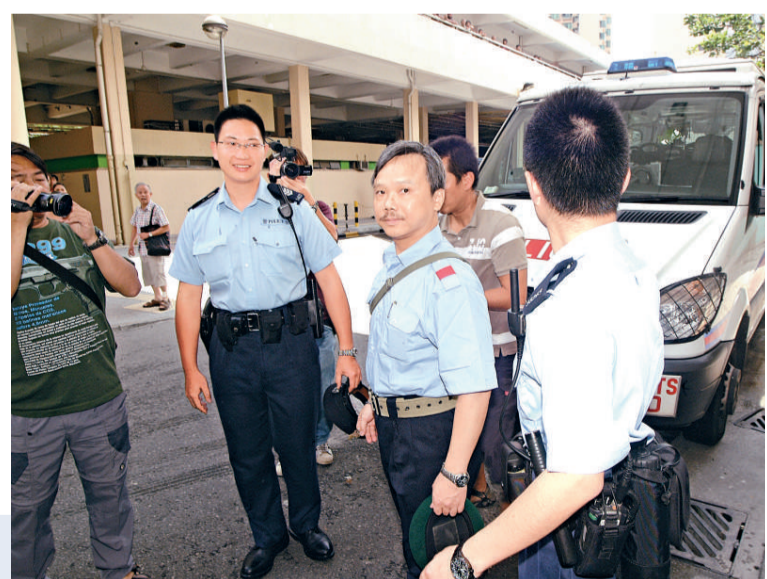
▶制服癖男被送院檢驗

有街坊說，該名男子居上址三十多年，據悉二十年前因投考警察沒有被取錄，導致精神出現問題，行爲怪異，有穿制服癖好，包括保安員、童軍、牧師、法官、甚至犯人服等，慣性在馬路大罵過路或候車老弱婦孺，邨民都繞路而行。居民曾聯署向房屋署投訴，要求將他調遷，惟房屋署回覆不能對「他」作出歧視，事件不了了之，有人因恐飛來橫禍，要求自己調遷。