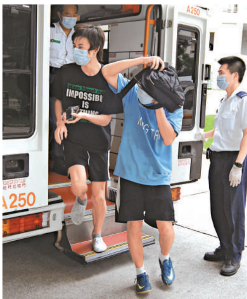
◀被耳環扯爛耳珠的足球小將

傷者送抵醫院時，見有傳媒追訪即開口求情，聲稱雙親如果知道他受傷的原因因斥罵，希望「放他一馬」不要報道。