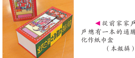
▲從前家家戶戶總有一本的通勝化作紙巾盒