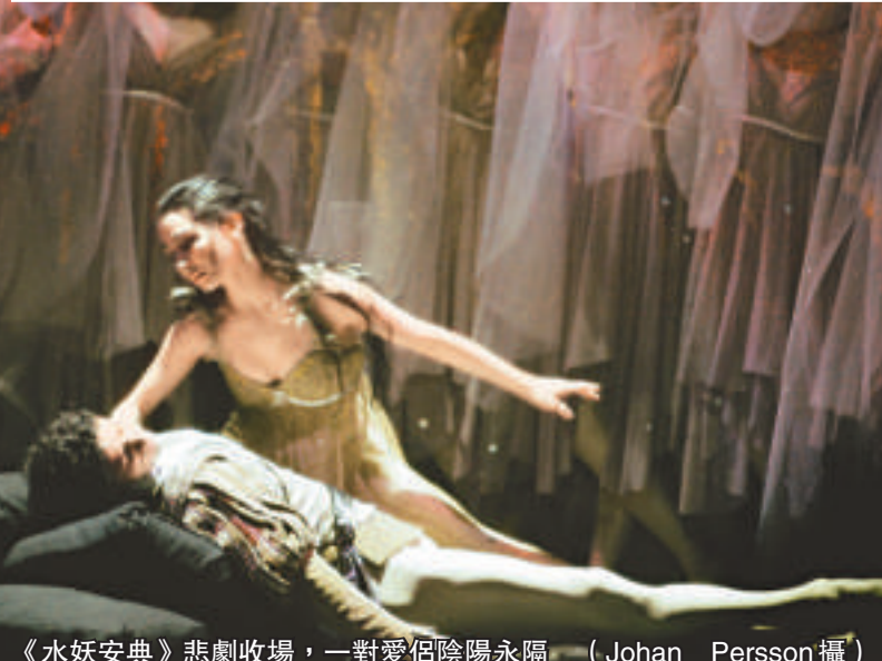
《水妖安典》悲劇收場，一對愛侶陰陽永隔