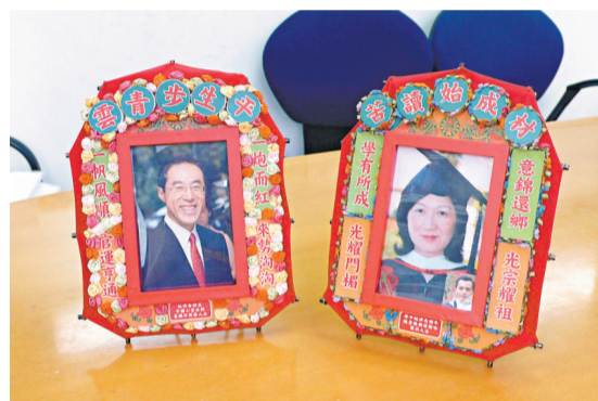
▲以傳統花牌相架，亦可亮燈

國家重大歷史題材美術創作工程雲集了目前內地美術界具權威和創作實力的藝術家，其中有德高望重的老藝術家，也有嶄露頭角的青年藝術家，還有一大批功底扎实的中年藝術家。如前中國美協主席靳尚誼、北京畫院院長王明明等藝術家均有作品入圍。目前，國家已向每位創作者提供了十到十二萬元資助經費，所有創作者都已完成作品創作，藝術委員會正對其進行驗收評審。展覽將於九月在中國美術館開幕。