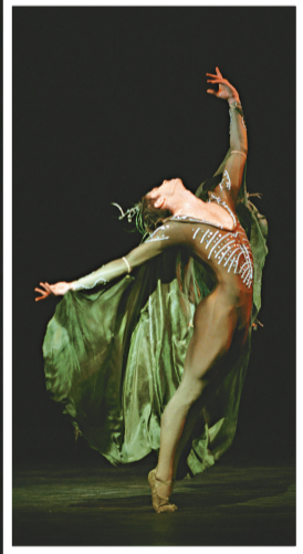
▲艾斯頓為海霸王一角設計多段爆發力強勁的舞蹈