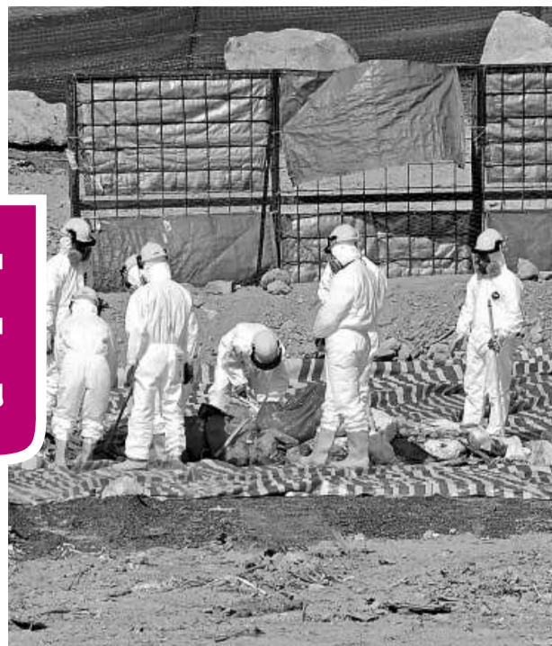
▲警方被誤導浪費人力時間在堆填區搜尋嬰屍 (資料圖片)

男嬰屍體，5日後仍無發現，被告其後被警管局辭退殮房助理職務。警方調查後揭發被告疑有誤導之嫌，遂落案起訴他提供虛假資料及企圖誤導警員等罪名。