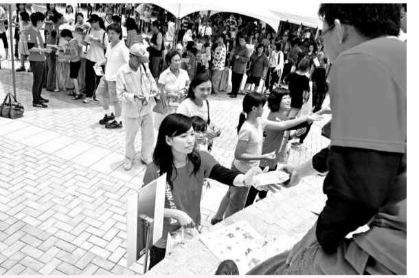
高雄市一家百貨公司開店一周年慶二日登場，推出限量一千一百一十五份一元商品炒熱買氣，吸引大批民眾前來搶購。（中央社）

馬英九今年五月出訪薩爾瓦多時，已被尼加拉瓜總統奧爾特加加約了三次，這次到訪尼國，隨行記者都擔心馬英九恐怕要被奧爾特加第四次放鴿子；不料卻是因為尼國首都市長自殺，而讓馬英九與奧爾特加的會面確定不會延期。