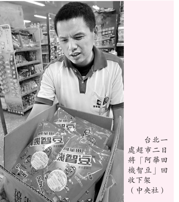
台北一處超市二日將「阿華田機智豆」回收下架。

【本報訊】中通社二日報導：台灣「行政院」院會二日正式核定通過縣市改制升格案，要求於明年年底完成；「內政部長」廖了以表示，配合土地規劃與行政區調整，全台三百六十八個鄉鎮市區，未來將整併為一百至一百五十個之間。