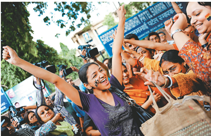
印度支持同性戀的人們二日在新德里慶祝高院裁定同性戀合法（法新社）

【本報訊】綜合通訊社二日報道：印度新德里最高法院二日以違反憲法賦予人權自由的理由，在解釋印度刑法第 377 條款時，宣布同性戀是成人兩相情願的隱私行為，不屬犯罪行為。