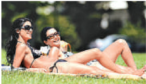
▲在英國布賴頓草地曬太陽的女郎