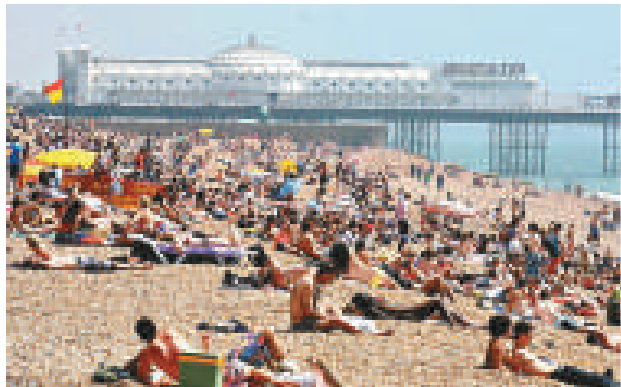
▲在英國南部海濱城市布賴頓，沙灘上擠滿了前來避暑的人們