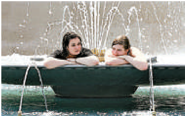
▲倫敦女孩在公園的噴泉下乘涼