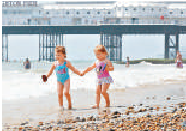
▲兩個小女孩在英國布賴頓享受陽光沙灘

【本報訊】綜合外電二日消息：歐洲許多國家，從比利時、奧地利一路往南到西班牙，一進入七月就受到熱浪侵襲。尤其是西班牙，最高溫達到攝氏四十度，比往年七月均溫高出十度以上。西歐各國氣象單位已發布高溫警報，提醒體弱與年長者注意避暑。