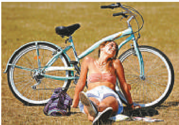
▲單車手在倫敦的公園裡休息（互聯網）