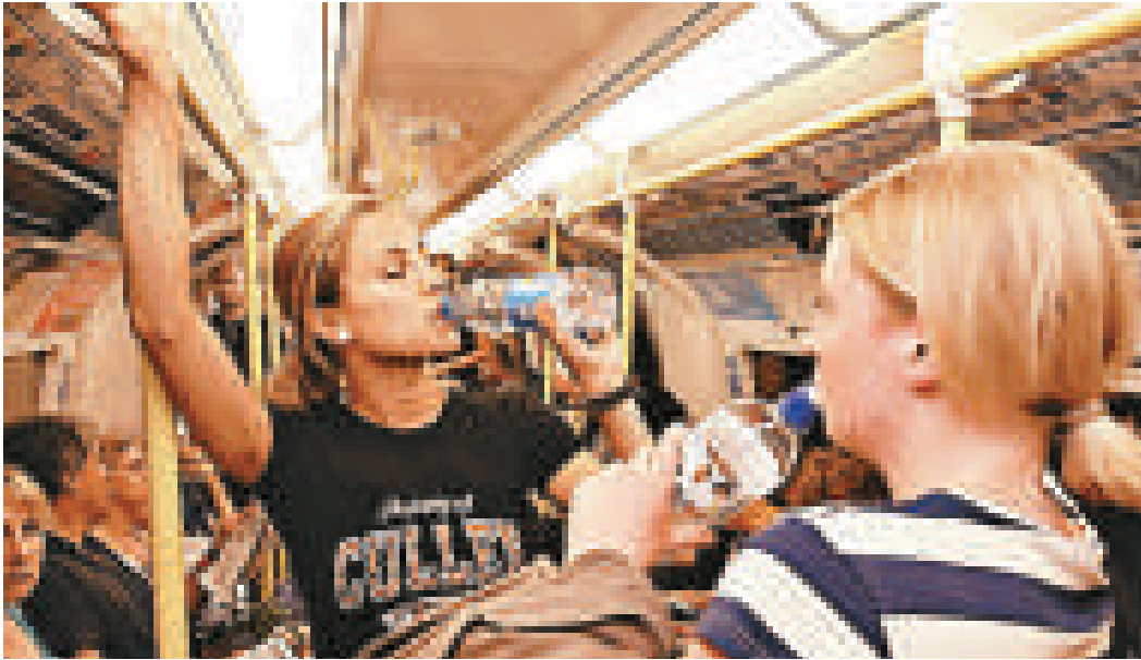
◀倫敦地鐵車廂甚至錄得攝氏三十五度，乘客飲水降溫

另訊，英國有兩隻被留在車內的警犬因中暑死亡。這兩隻德國牧羊狗六月三十日在諾丁漢郡警察總部停車場的某輛車中死亡。諾丁漢郡警方說他們已聯絡動物福利調查員。警方未有透露兩隻狗留在車內多久。